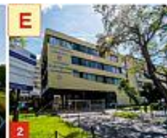
2 WYDZIAŁ ELEKTROTECHNIKI I INFORMATYKI