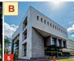
5 WYDZIAŁ BUDOWNICTWA I ARCHITEKTURY