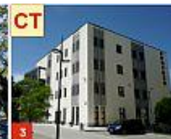
3 CEM-TECH UL. NADBYSTRZYCKA 38 B