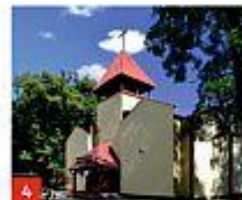
4 KOŚCIÓŁ RZYMSKOKATOLICKI PARAFIA PRZEJMENIA PANSKIEGO