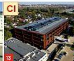
11 CENTRUM INNOWACJI I ZAAWANSOWANYCH TECHNOLOGII