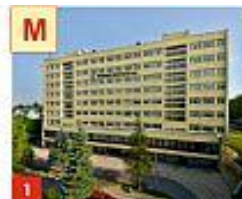
1 WYDZIAŁ MECHANICZNY