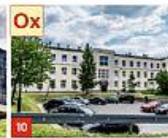
9 WYDZIAŁ PODSTAW TECHNIKI