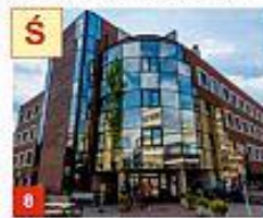
7 WYDZIAŁ INŻYNIERII ŚRODOWISKA