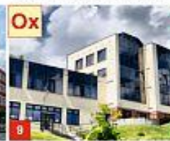
8 WYDZIAŁ ZARZĄDZANIA